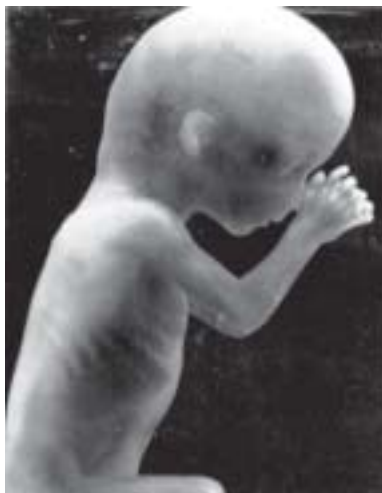
Um feto humano com quatro meses de vida.

E o destinatário deste direito não é a mãe, é a criança”, afirmou.