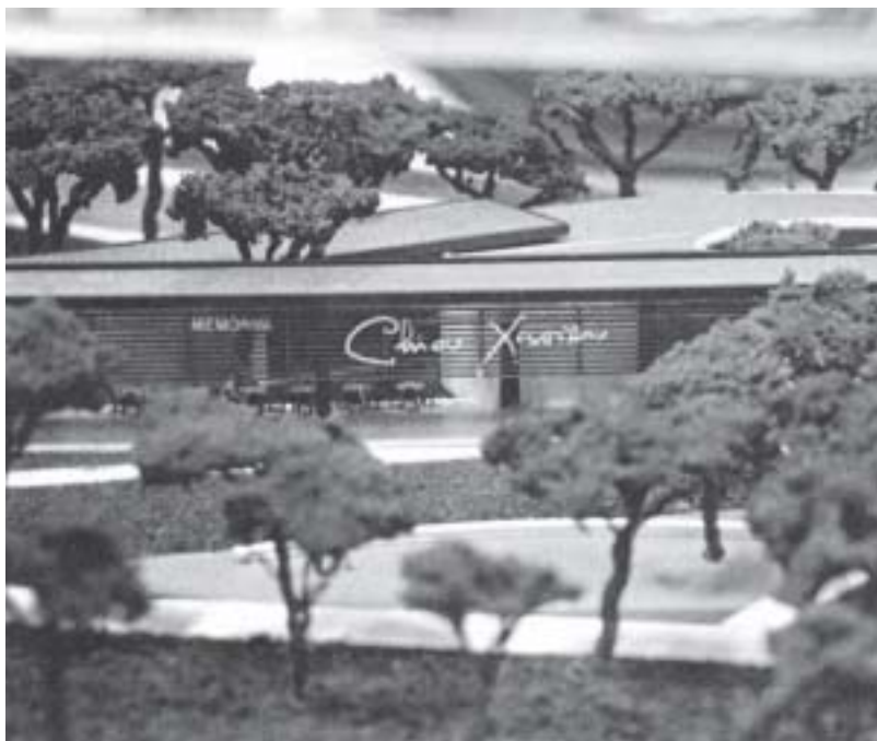
Maquete do Memorial Chico Xavier

O Memorial, situado na Avenida Dom Luiz Maria Santana, 141, no Bairro Santa Maria, terá 1.305 m 2 , tendo por área pavimentada descoberta 2.700 m 2 .