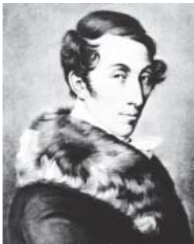
Carl Maria von Weber, célebre compositor alemão.

Grandes Óperas” (volume 7), a estréia redundou num estrondoso sucesso de público e o Teatro Lírico de Berlim a manteve em cartaz por longo período. O tema, o desenrolar do melodrama, envolvia médiuns e Espíritos, mostrados sem cerimônia no palco cênico. Isso agradou em muito o público alemão, que tomava contato com o mundo insólito dos Espíritos, ainda que estas informações viessem através de encenação lírica.