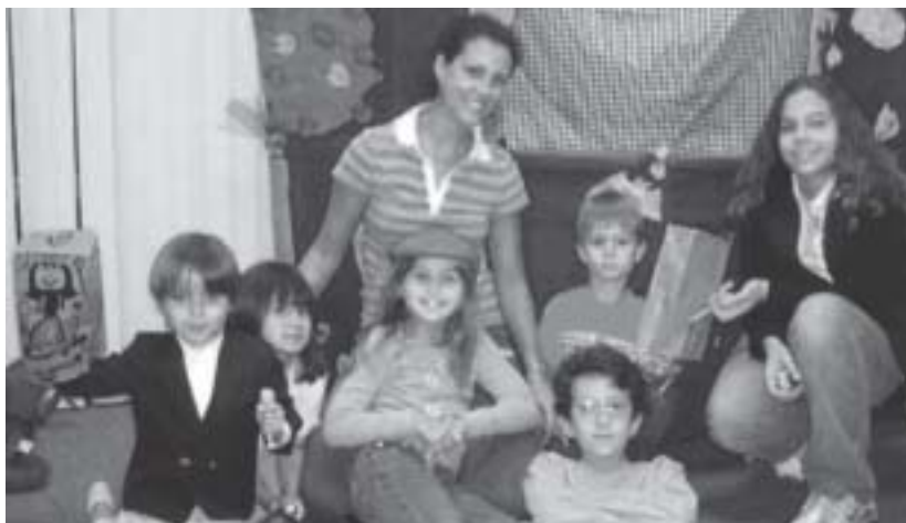
Evangelizadoras e crianças do Allan Kardec Spiritist Center of Orlando - Flórida

elas preferem as aulas em inglês, surgindo aí outra dificuldade para os(as) evangelizadores(as).