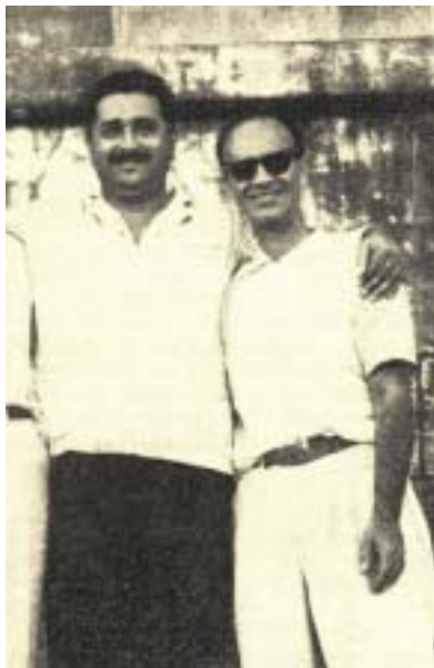
Em 1965, Chico Xavier visita o médium Arigó na cadeia pública de Conselheiro Lafaiete.

Alguns fatos da vida dos médiuns Chico Xavier e Arigó.