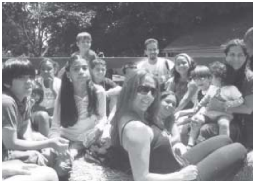
Crianças e adultos no Central Park, em New York

Baltimore, Maryland, próxima de Washington, cujas reuniões são todas em inglês.