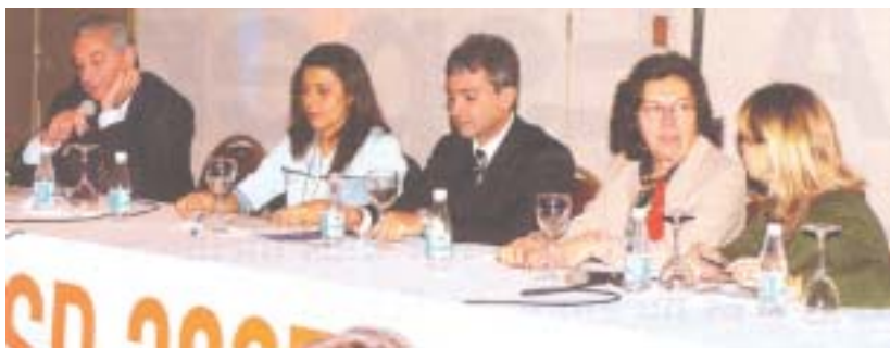
Membros de um dos painéis do Congresso Médico-Espírita.