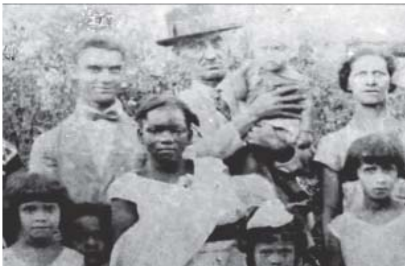
Detalhe da foto ao lado.

ele, o maior médium da história, que, por certo, o inspiraram neste pensamento. (...)