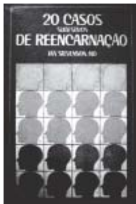
Capa do livro 20 Casos Sugestivos de Reencarnação que foi editado no Brasil, em 1970, apenas quatro anos após o seu lançamento nos Estados Unidos.