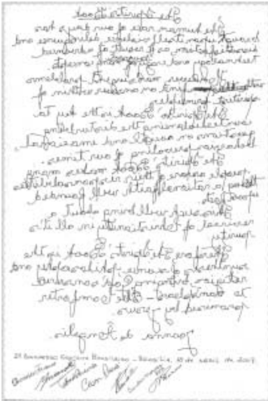
Texto da psicografia especular, em inglês, recebida por Divaldo P. Franco, com as assinaturas dos integrantes da Mesa Diretora dos trabalhos.

O Livro dos Espíritos torna muitas pessoas conscientes de suas responsabilidades, através da fé racional bem fundada sobre fatos. Isto trará o renascimento do Cristianismo em toda a sua pureza.