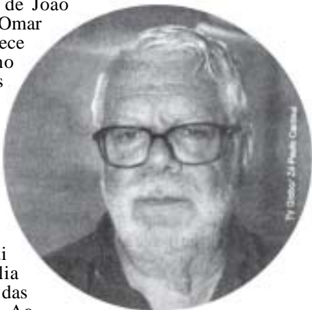
O escritor Manoel Carlos, autor de Páginas da Vida e de outras novelas.

Em Cobras e Lagartos , de João Emanuel Carneiro, o milionário Omar Pasquim (Francisco Cuoco) aparece constantemente para Foguinho (Lázaro Ramos) – os telespectadores apostam que ele é mesmo um “fantasma” e não a suposta consciência de Foguinho. Em Páginas da Vida , de Manoel Carlos, Nanda (Fernanda Vasconcelos) enfrenta uma gravidez sozinha, morre deixando um casal de gêmeos e começa a aparecer para o pai (Marcos Caruso) e a mãe (Lília Cabral) para evitar a separação das crianças, executada pela última. Ao jornal Agora , o autor declarou recentemente que em todas as suas novelas “pessoas que morrem aparecem para alguns vivos”.