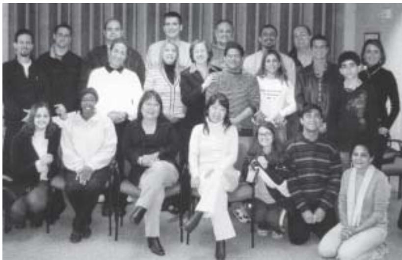
Alguns dirigentes e trabalhadores espíritas dos EUA presentes no I Simpósio Espírita dos EUA.

abril de 2007 na cidade de Baltimore, Estado de Maryland, com o objetivo de prestar homenagem aos 150 anos do Espiritismo. Na história da América do Norte, este foi o primeiro evento espírita em nível nacional realizado inteiramente na língua inglesa. O movimento espírita dos EUA finalmente criara a sua identidade. “ Este será um marco na história do movimento espírita dos EUA, uma vez que o Espiritismo finalmente será inserido na cultura americana ”, afirmou Divaldo Franco, em sua mensagem, via email, para o evento. A audiência comoveu-se também ao assistir à vídeo-mensagem de Raul Teixeira, falando especialmente para o evento, em inglês fluente.