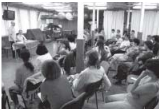
Em Bratislava, capital da República Eslava, foi realizado um Seminário em dois módulos.

Dia 2 as atividades tiveram lugar na cidade de Bratislava, capital da República Eslava, para onde se transferiram, a fim de realizar o Seminário O CAMINHO DA PAZ E DA SAÚDE, em dois módulos, iniciando-se às 15h00 e concluindo-se às 18h00, com dois pequenos intervalos. O tema, traduzido ao