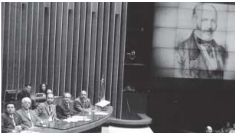
Mesa do Plenário e projeção da imagem de Allan Kardec