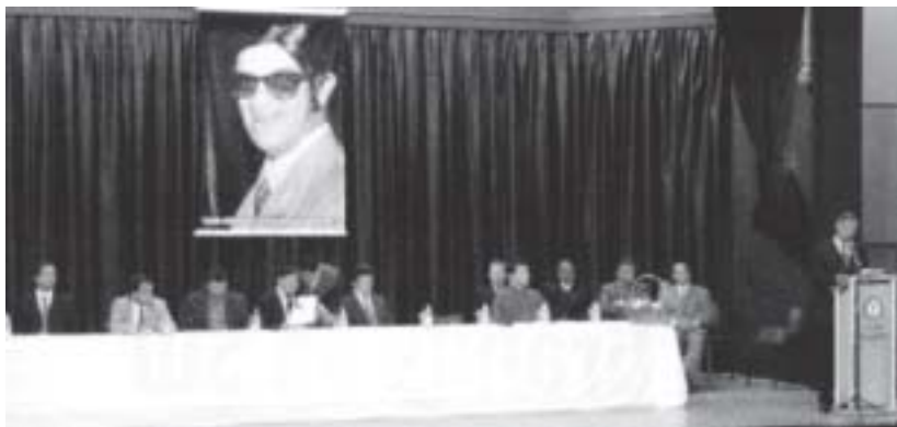
Sessão solene da Câmara Municipal de Matão.

espíritas de Matão, todas enfatizando aspectos da vida e obra de Francisco Cândido Xavier.