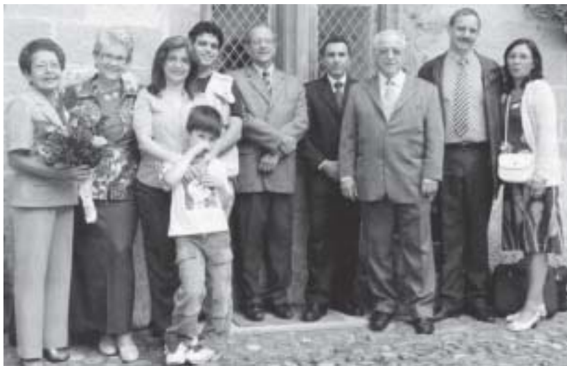
Palestrantes e organizadores do evento

atividades comemorativas, puderam conhecer o Museu, que fica no próprio castelo.