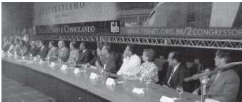
Mesa de abertura do congresso

“O 2º Congresso Espírita Brasileiro, promovido pela Federação Espírita Brasileira, teve a maior parte de sua programação desenvolvida no Centro de Convenções Ulysses Guimarães, em Brasília. No dia 13 de