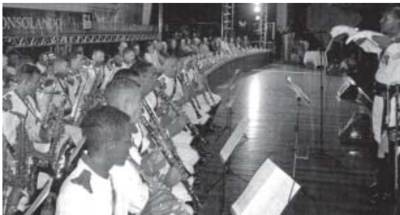
Apresentação dos Dragões da Independência