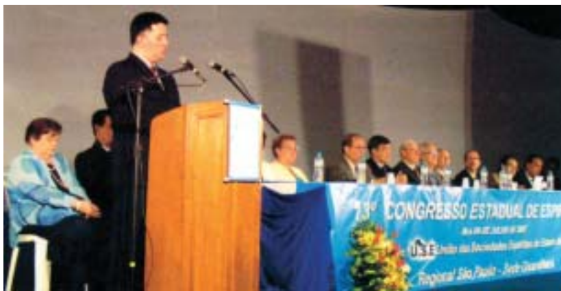
Composição da mesa na solenidade de abertura.