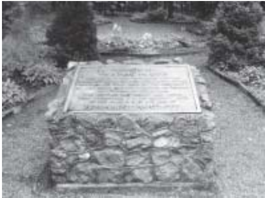
Obelisco construído em memória da família Fox, em Lily Dale - Nova York, no local onde a casa da Família Fox, de Hydesville, foi transferida, em 1916, e durou até 1955, quando incendiou-se.