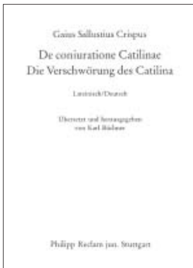
Página de rosto do livro De coniuratione Catilinae/Die Verschwörung des Catilina, bilingüe, página a página, em latim e alemão.

(a) Coleta: O trabalho de pesquisa foi iniciado em agosto de 2004.